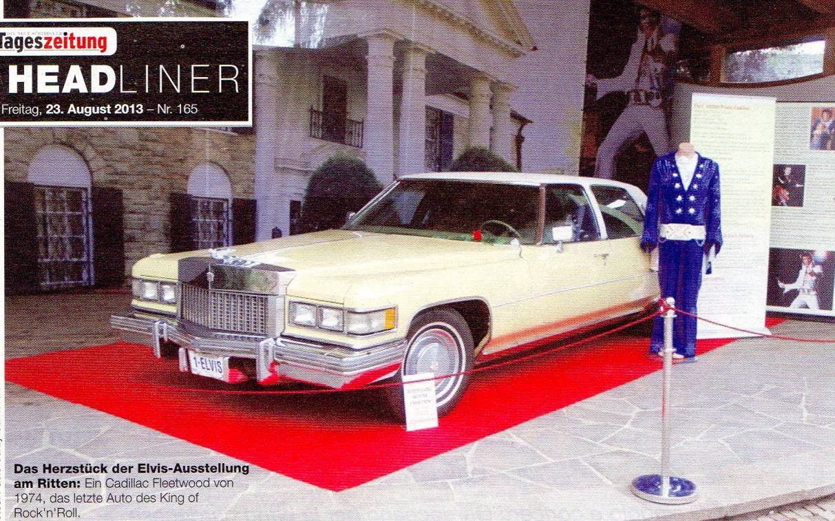
Das Herzstück der Elvis-Ausstellung am Ritten: Ein Cadillac Fleetwood von 1974, das letzte Auto des King of Rock'n'Roll.